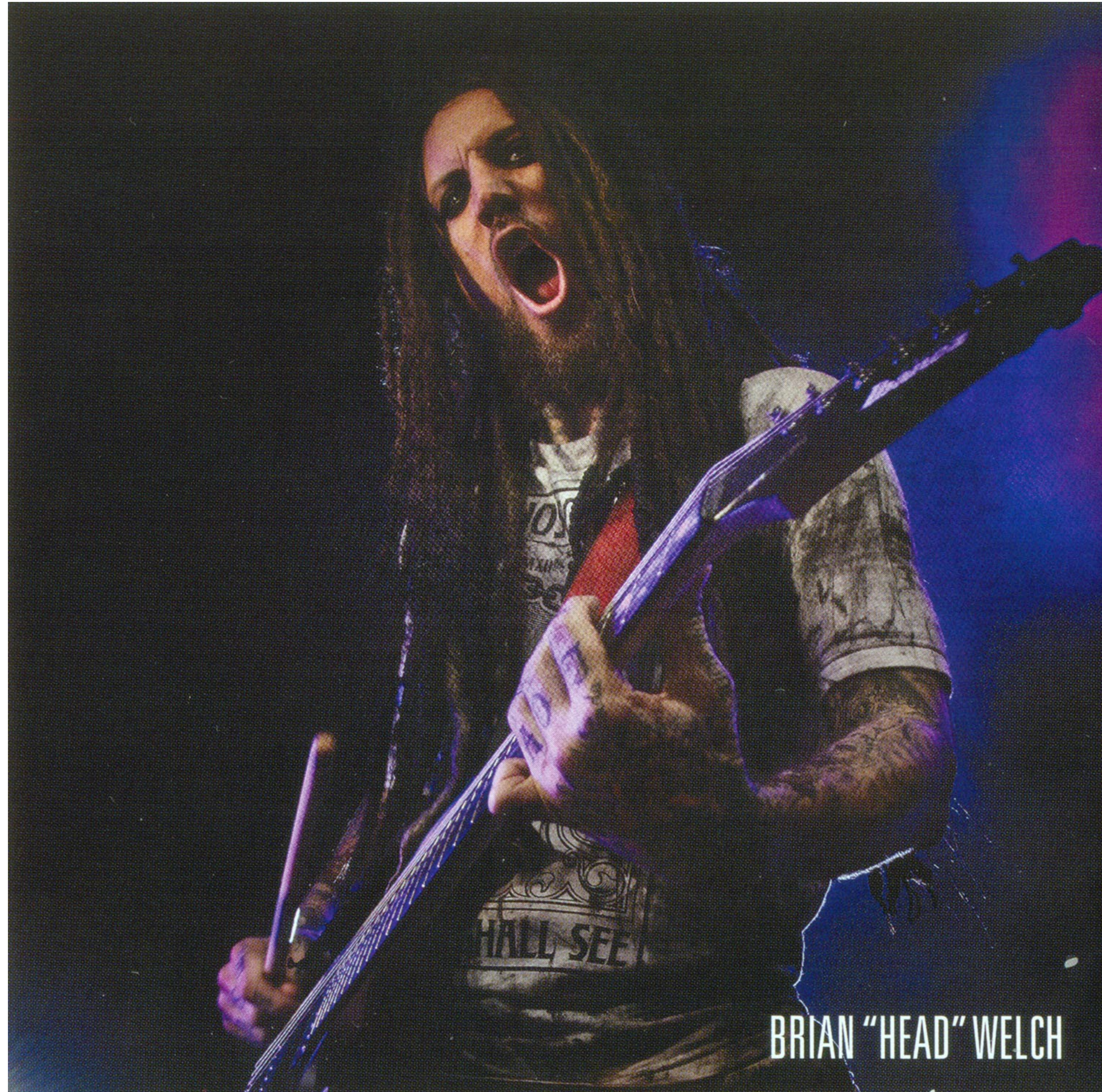
BRIAN "HEAD" WELCH